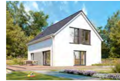
Family 136 46