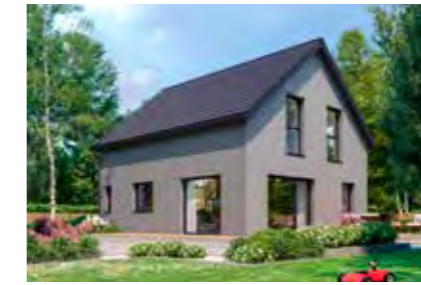
Family 117 38