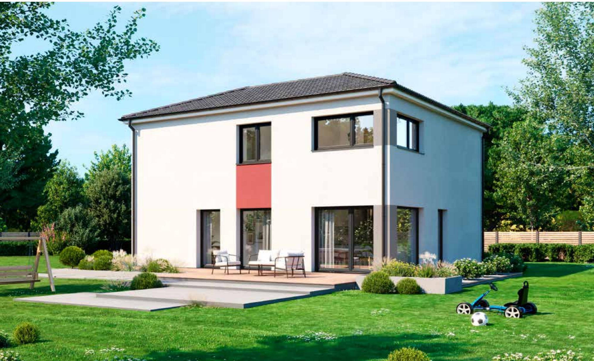
Abbildungen zeigen teilweise individuelle Zusatzausstattung.