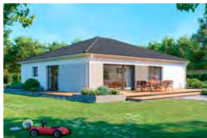
Family 127 24