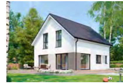
Family 108 34