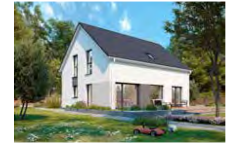
Family 155 54