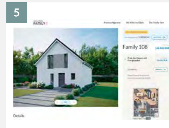
5 Jetzt können Sie Ihr Wunschhaus absenden. Ihr Berater meldet sich umgehend bei Ihnen.