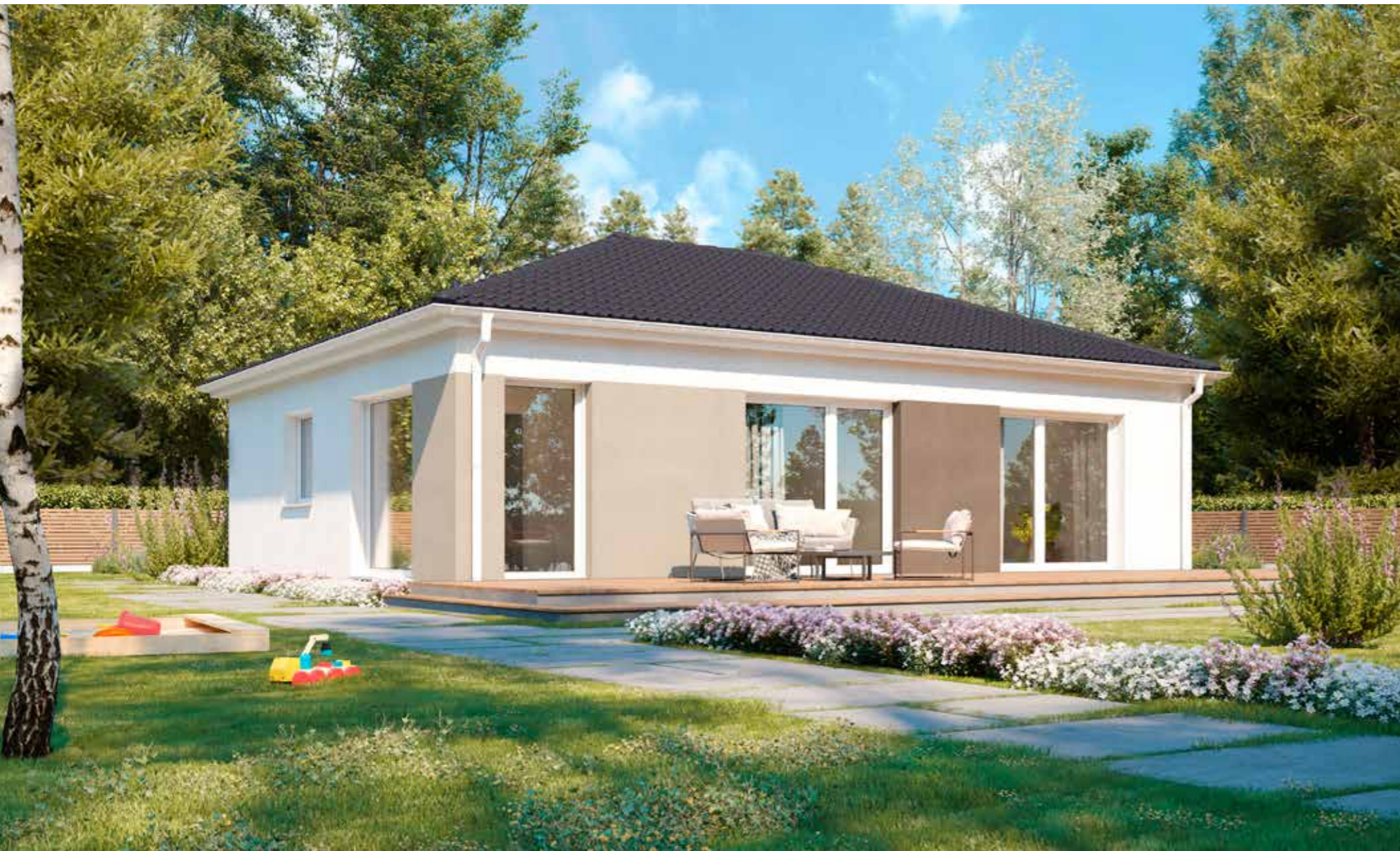
Abbildungen zeigen teilweise individuelle Zusatzausstattung.