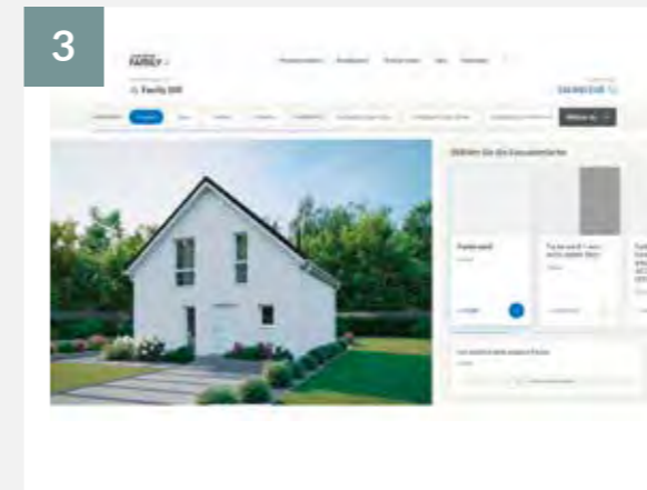
3 Wählen Sie Ihren Grundriss aus.