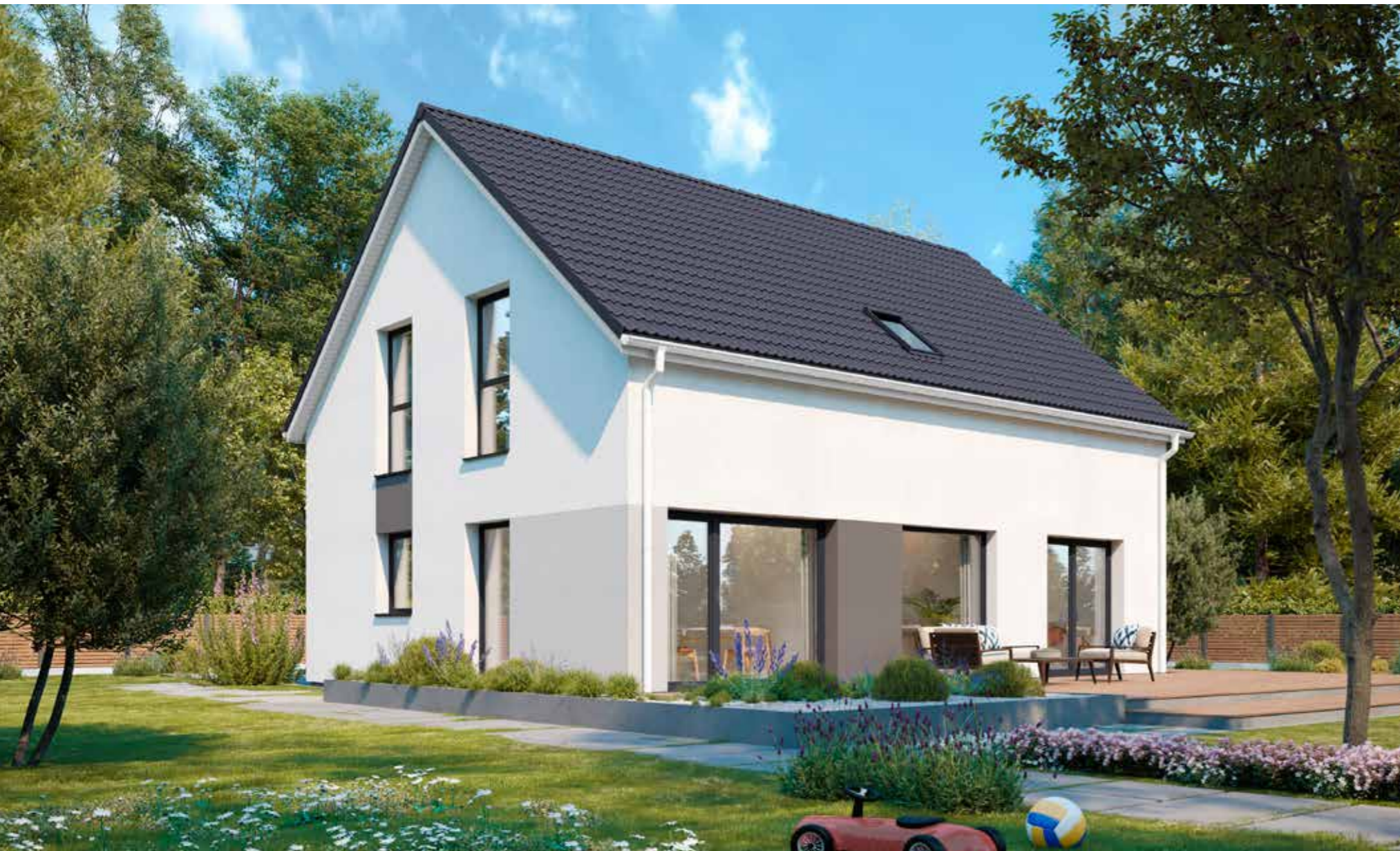
Abbildungen zeigen teilweise individuelle Zusatzausstattung.