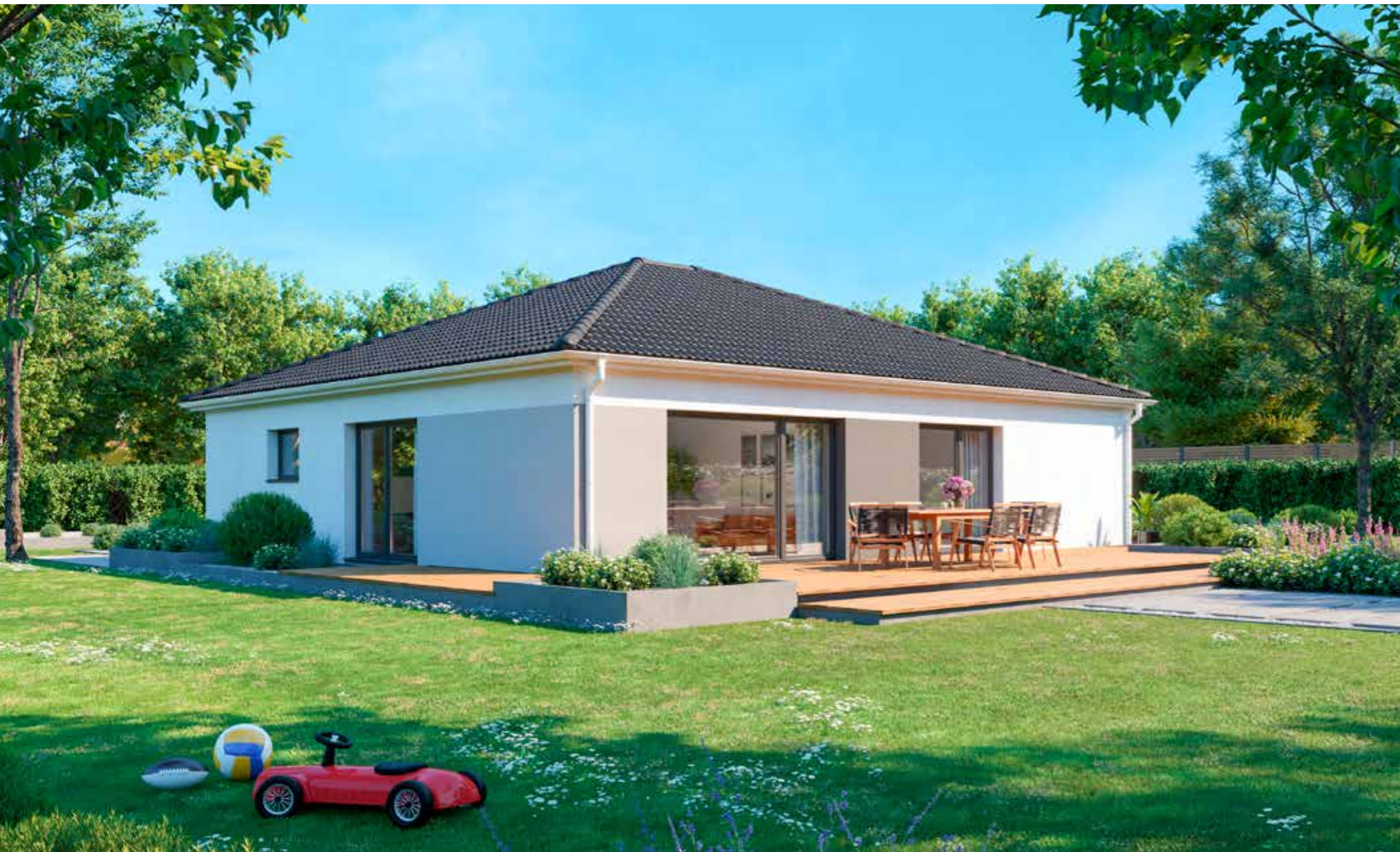
Abbildungen zeigen teilweise individuelle Zusatzausstattung.