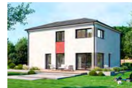
Family 144 64