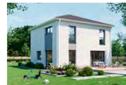
Family 130 60