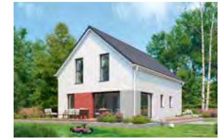
Family 133 42