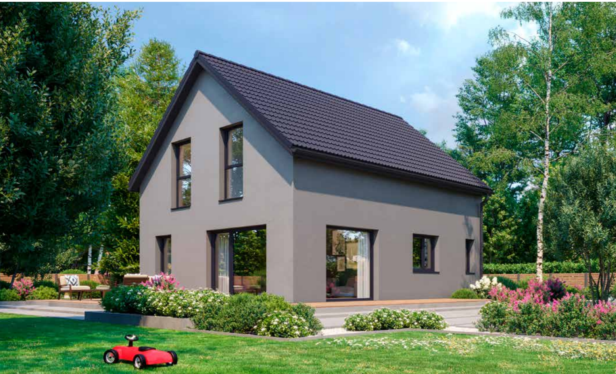
Abbildungen zeigen teilweise individuelle Zusatzausstattung.