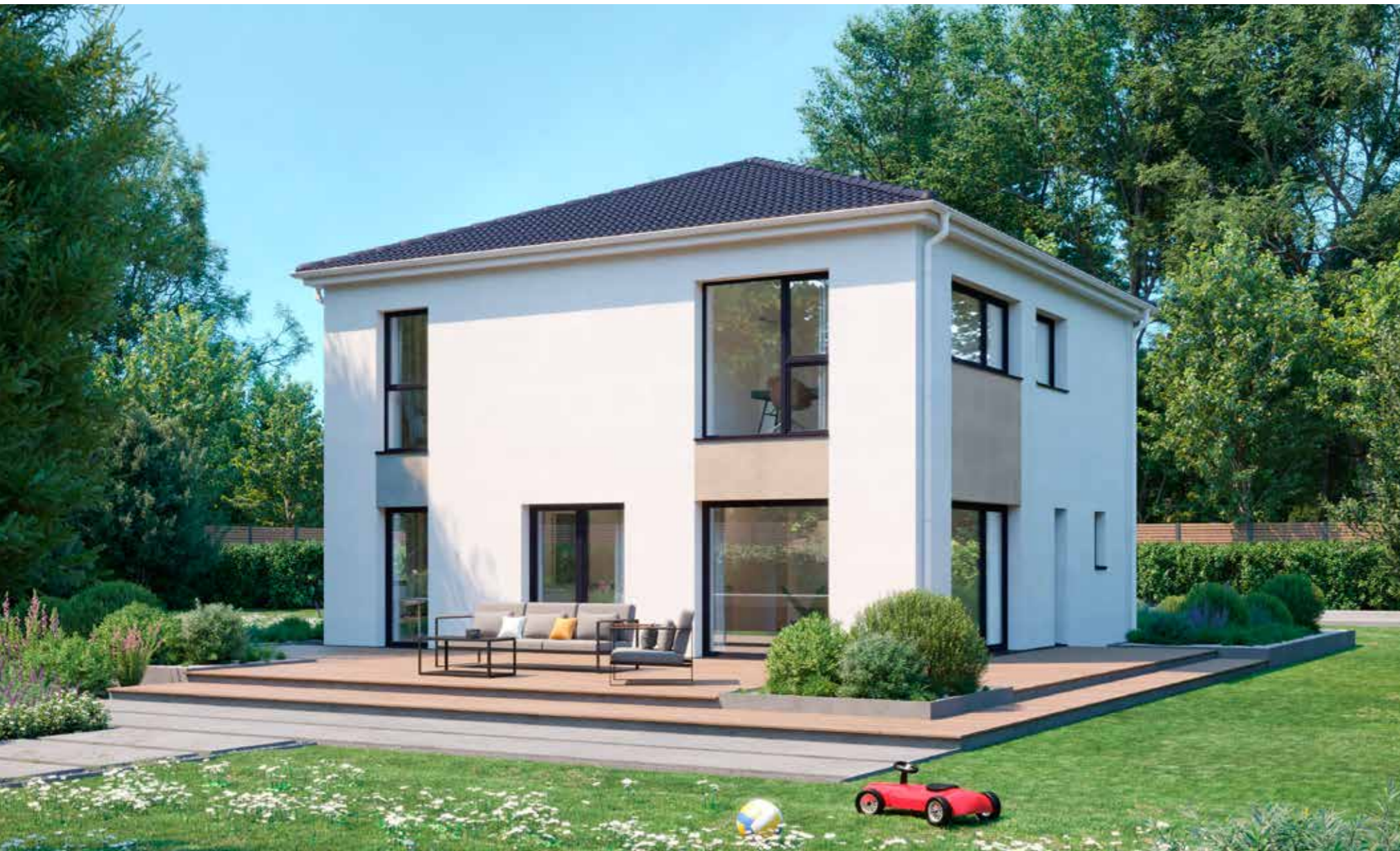
Abbildungen zeigen teilweise individuelle Zusatzausstattung.