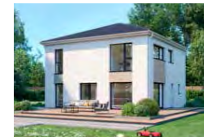
Family 157 68