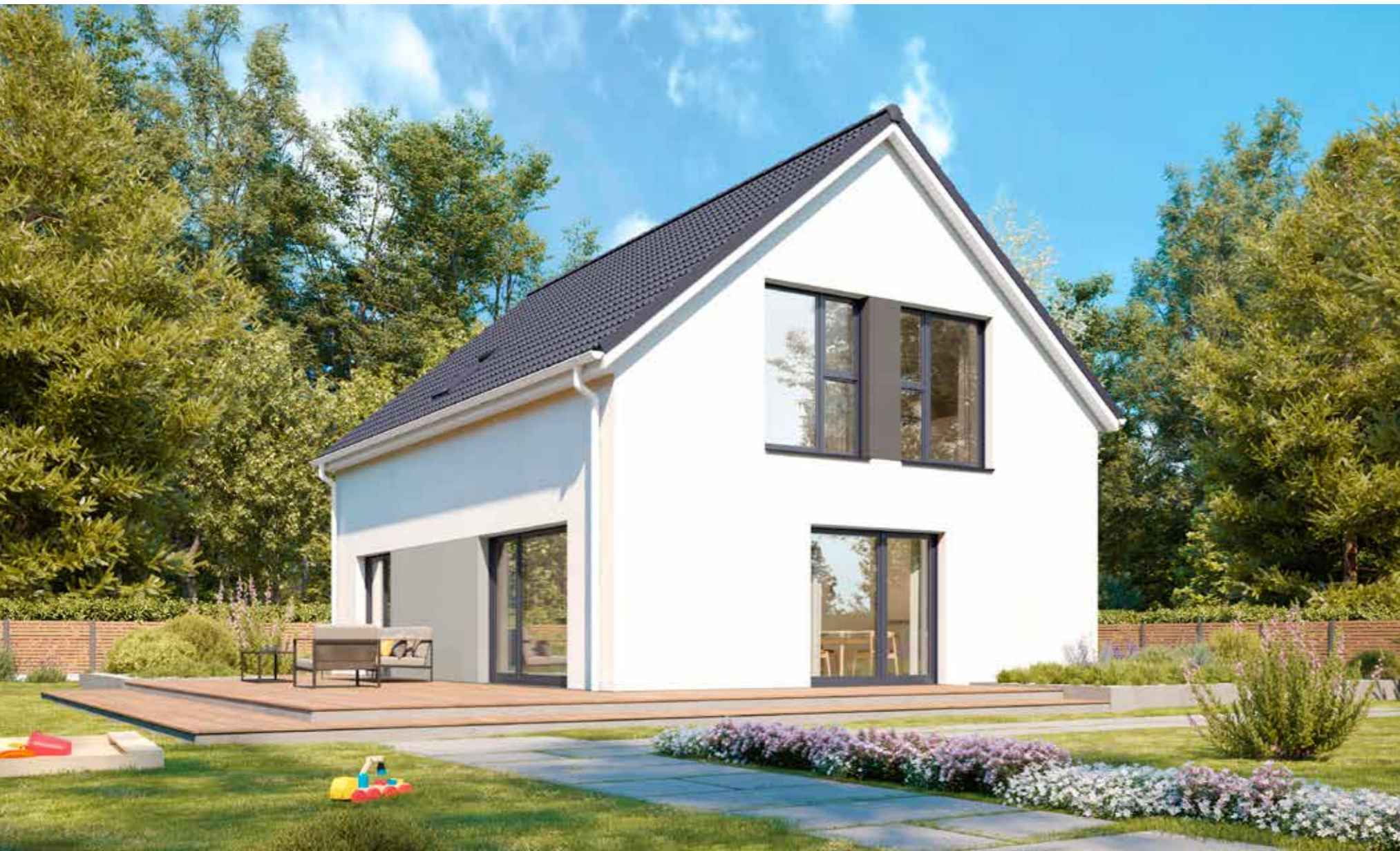
Abbildungen zeigen teilweise individuelle Zusatzausstattung.