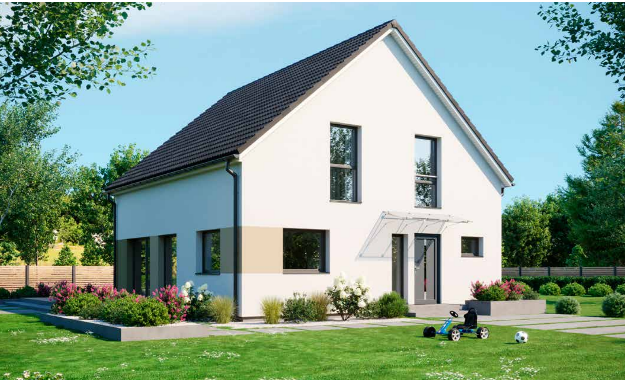
Abbildungen zeigen teilweise individuelle Zusatzausstattung.