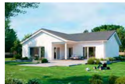
Family 111 20