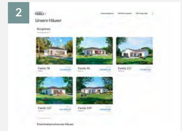
2 Wählen Sie Ihr Wunschhaus und starten Sie die Konfiguration.