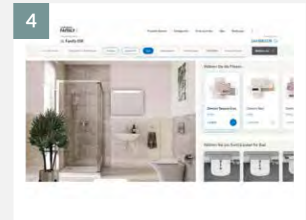
4 Wählen Sie die Innenausstattung Ihres Hauses.