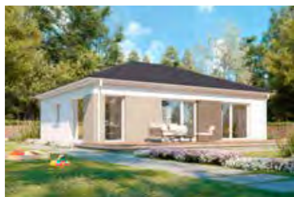
Family 78 12