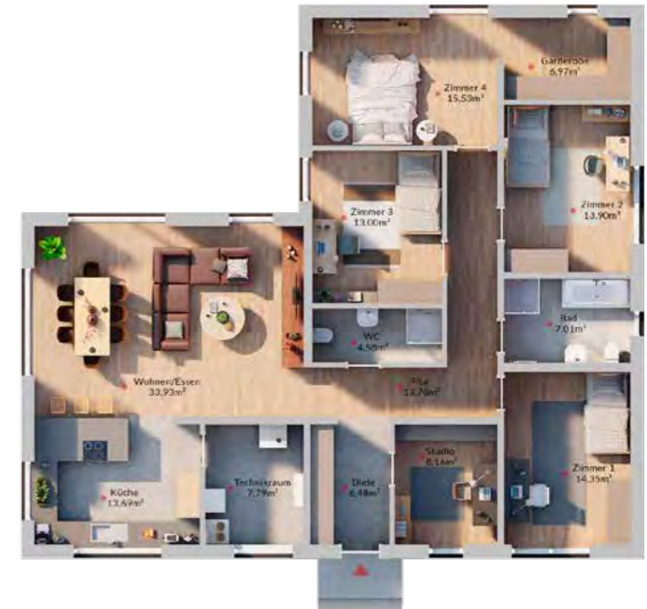
Abbildungen zeigen teilweise individuelle Zusatzausstattung.