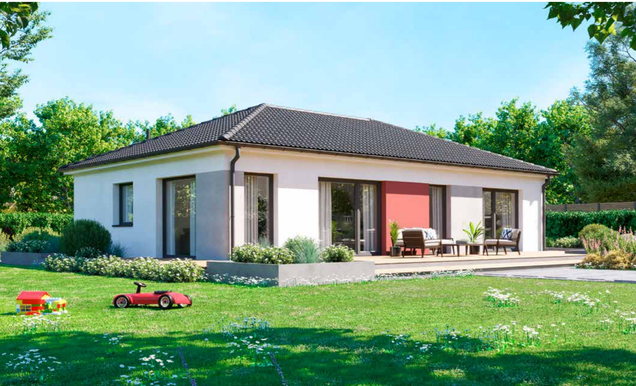
Abbildungen zeigen teilweise individuelle Zusatzausstattung.