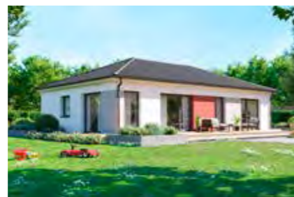
Family 96 16