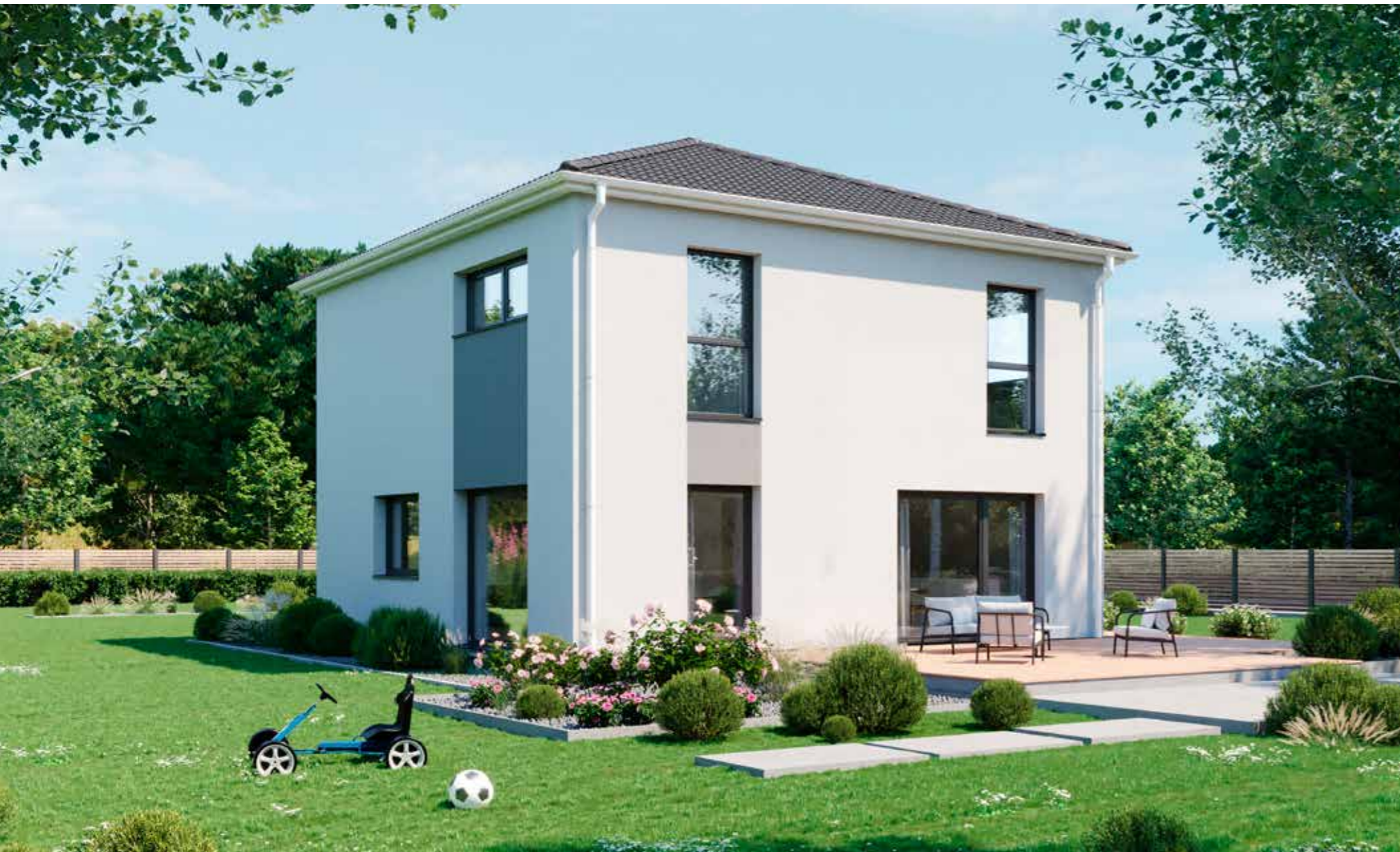
Abbildungen zeigen teilweise individuelle Zusatzausstattung.