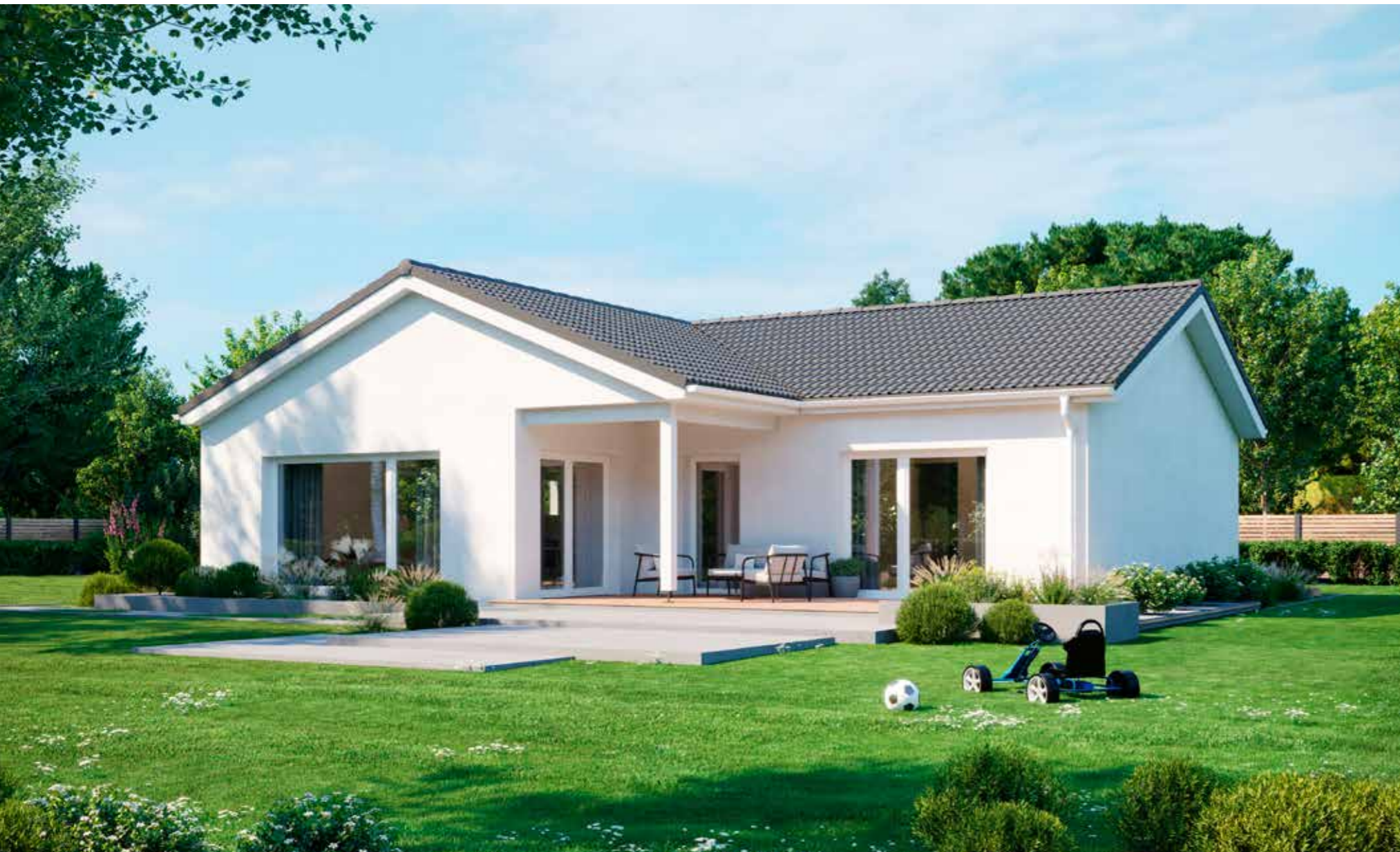
Abbildungen zeigen teilweise individuelle Zusatzausstattung.