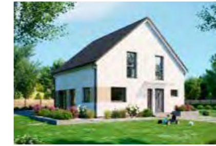
Family 147 50