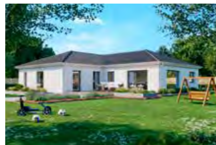
Family 159 28