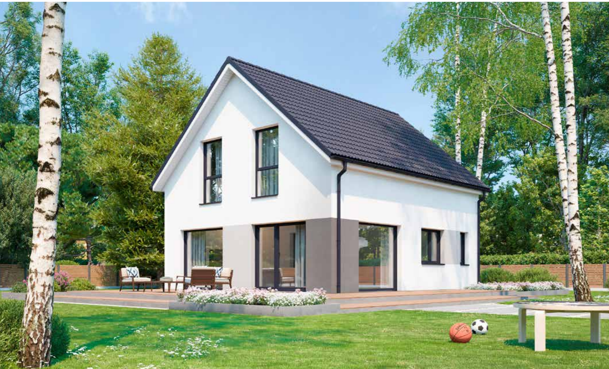
Abbildungen zeigen teilweise individuelle Zusatzausstattung.