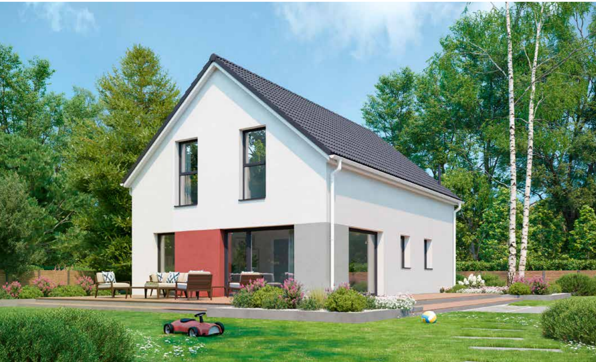
Abbildungen zeigen teilweise individuelle Zusatzausstattung.